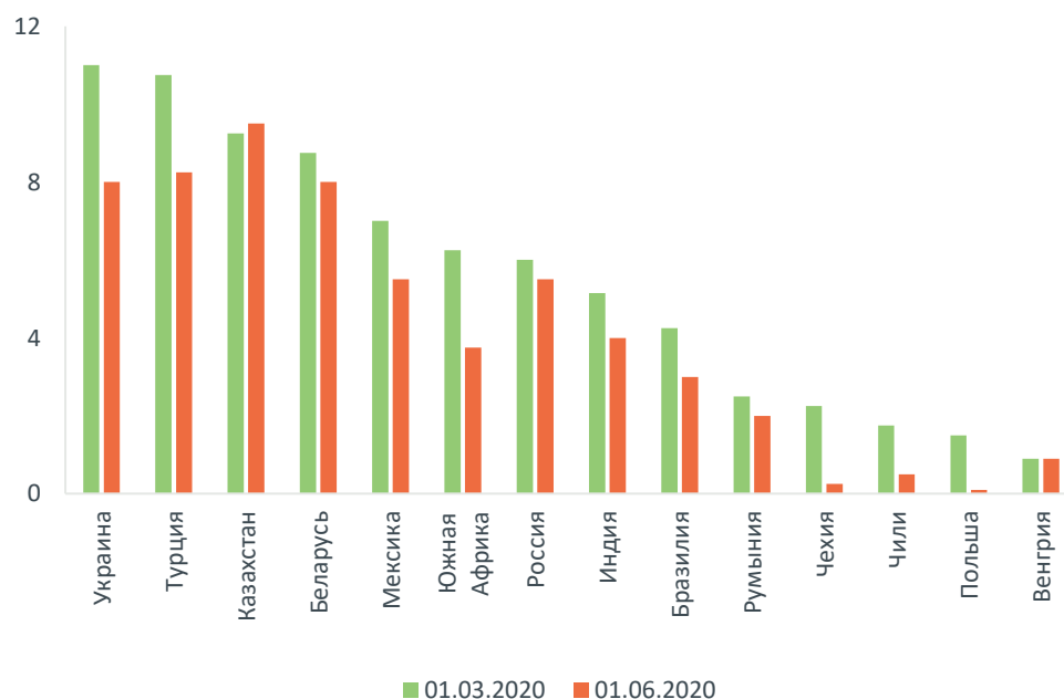
Рисунок 1. Динамика базовой ставки в рассматриваемых странах в первые три месяца кризиса 2020 года

Исключением стал Казахстан, где базовая ставка выросла до 12%, а затем снизилась до 9,5% (несколько выше докризисного уровня). Такая реакция монетарных властей была обусловлена опасениями, связанными с рисками для финансовой стабильности страны вследствие давления на валютный курс из-за резкого падения цен на нефть и снижения добычи в рамках сделки ОПЕК+. Ослабление данных опасений позволило Казахстану смягчить свою монетарную политику.