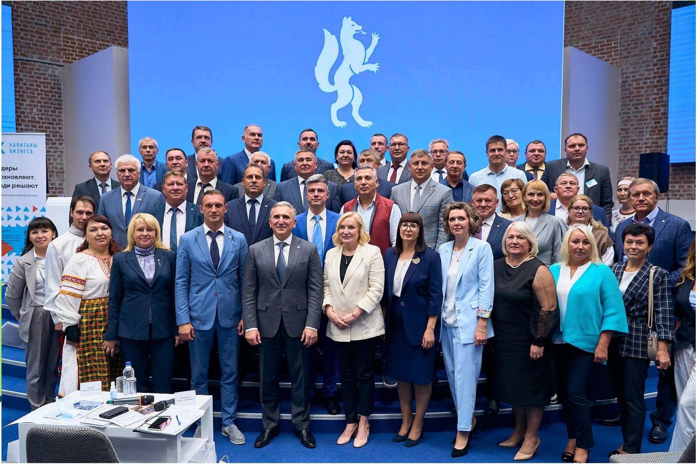
Топовые компетенции малого и среднего бизнеса