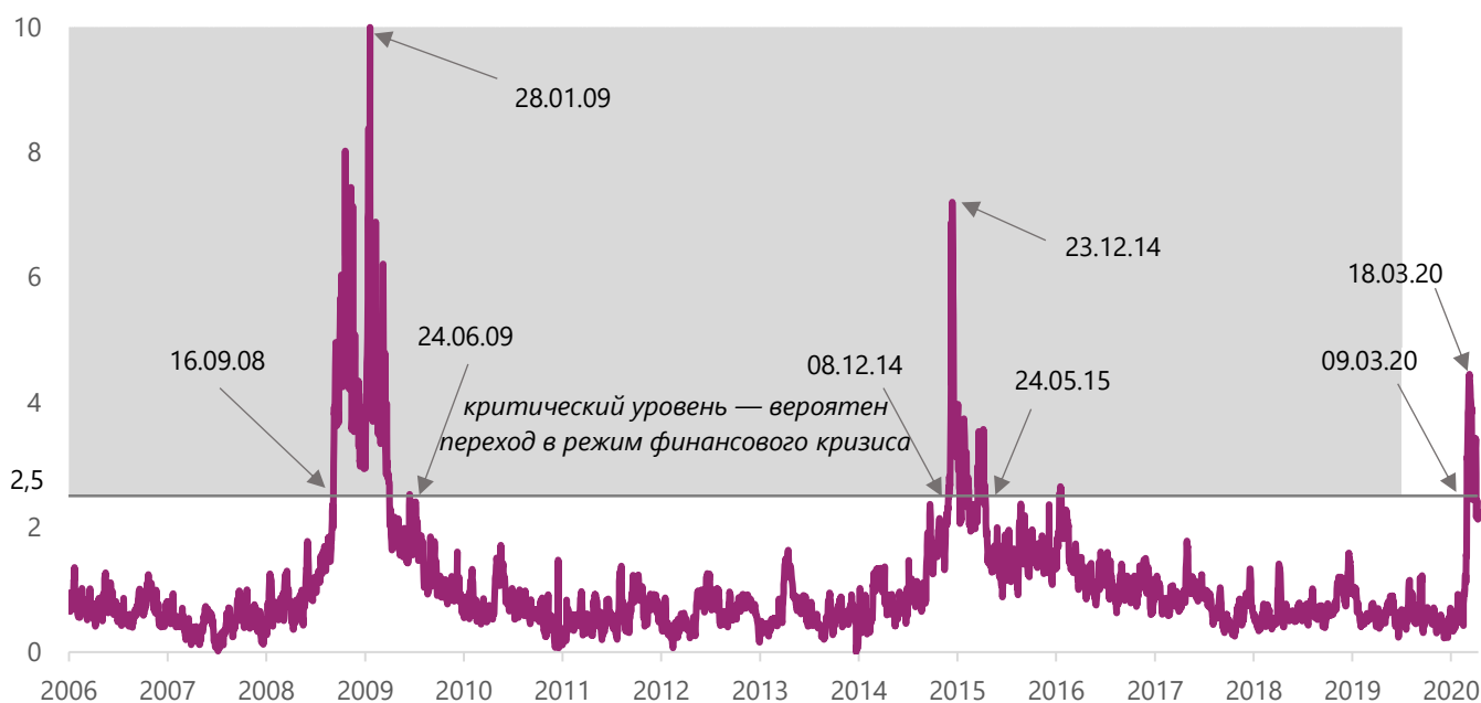
Рисунок 2. Динамика индекса финансового стресса для России (ACRA FSI)