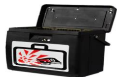
ОБЕРТУР Cash Protection