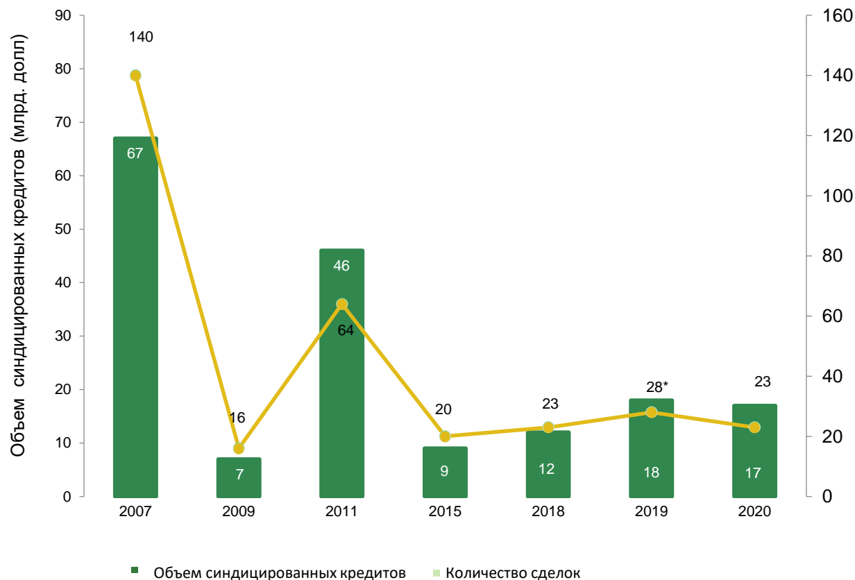
Динамика рынка синдицированного кредитования в России