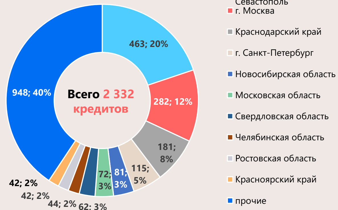
Регионы в разрезе сумм кредитов, млрд