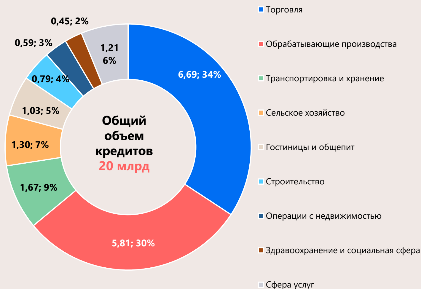
Отрасли в разрезе сумм кредитов, млрд