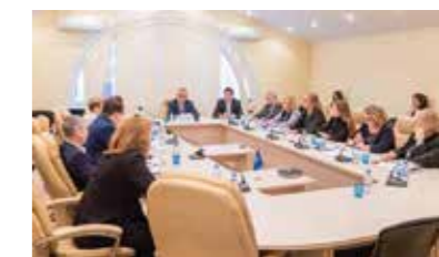
Рабочая встреча по применению положений Налогового кодекса Российской Федерации