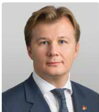
Поляков Илья Андреевич

— Председатель Правления АО «АЛЬФА-БАНК»