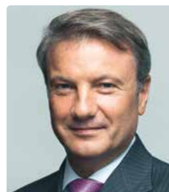
Греф Герман Оскарлович

— Председатель Совета директоров ПАО КБ «Центр-инвест»