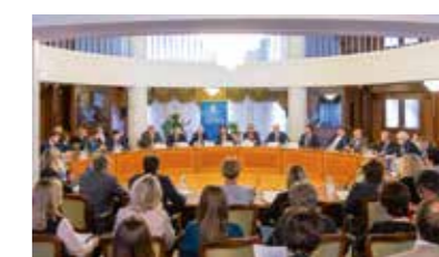
Совещание по вопросам деятельности банков с базовой лицензией