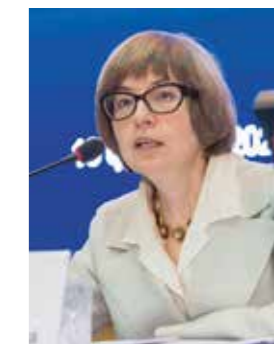
Юдаева Ксения Валентиновна Первый заместитель Председателя Банка России