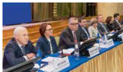
Встреча представителей кредитных организаций с руководством Банка России