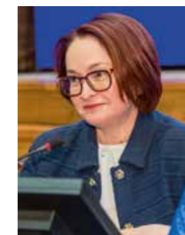
Набиуллина Эльвира Сахипзадовна Председатель Банка России

В мероприятиях Ассоциации участвуют в качестве спикеров и слушателей представители органов власти, Банка России и коммерческих организаций из различных регионов