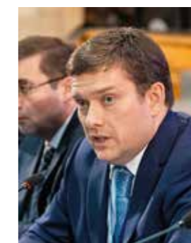
Журавлев Николай Андреевич Заместитель Председателя Совета Федерации