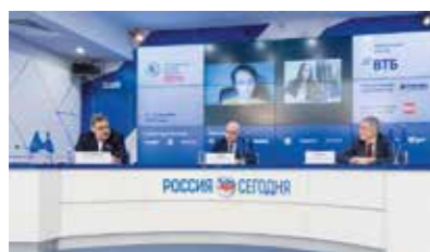
VI Банковская юридическая конференция «Новые вызовы и возможности: регуляторные и правовые тенденции в банковской деятельности»