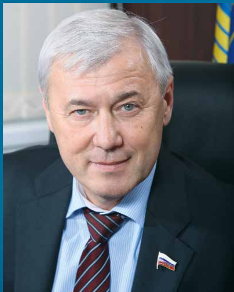
Аксаков Анатолий Геннадьевич

— Председатель Совета Ассоциации банков России, Председатель Комитета Государственной Думы Федерального Собрания Российской Федерации по финансовому рынку