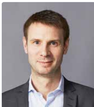
Хьюз Оливер Чарльз

— Председатель Правления АО «Тинькофф Банк»