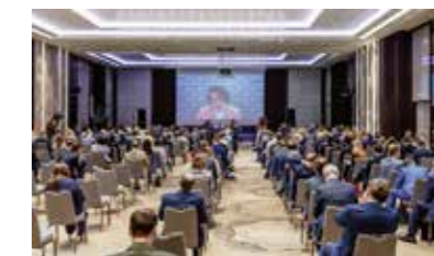
II Съезд Ассоциации банков России

Онлайн-конференция «В федеральных сетях: как выживают региональные банки» в формате ВКС, 20 августа 2020 г.