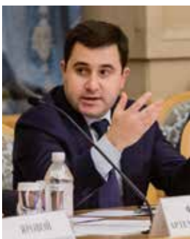
Сташишин Никита Евгеньевич Заместитель Министра строительства и жилищно-коммунального хозяйства Российской Федерации