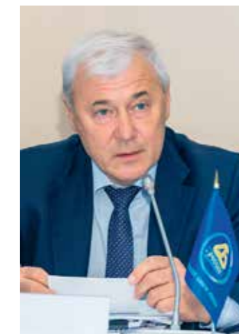
Аксаков Анатолий Геннадьевич

Председатель Комитета Государственной Думы Федерального Собрания Российской Федерации по финансовому рынку, Председатель Совета Ассоциации банков России