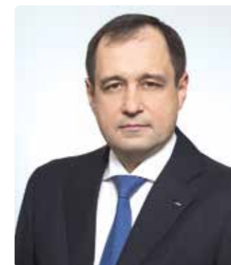
Гараев Зуфар Фанилович

— Заместитель Председателя Правления Государственной корпорации развития «ВЭБ.РФ»