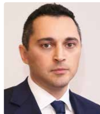
Газарян Юрий Гарунович

— Заместитель Председателя Правления Государственной корпорации развития «ВЭБ.РФ»