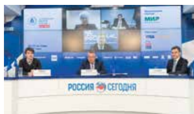
XIV Международная конференция «Платежная индустрия: практика и трансформация после пандемии»