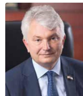
Грибанов Владимир Иванович

— Президент, Председатель Правления ПАО Сбербанк