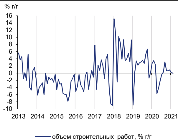
Рис. 2. Объем строительных работ сохранился на уровне прошлого года